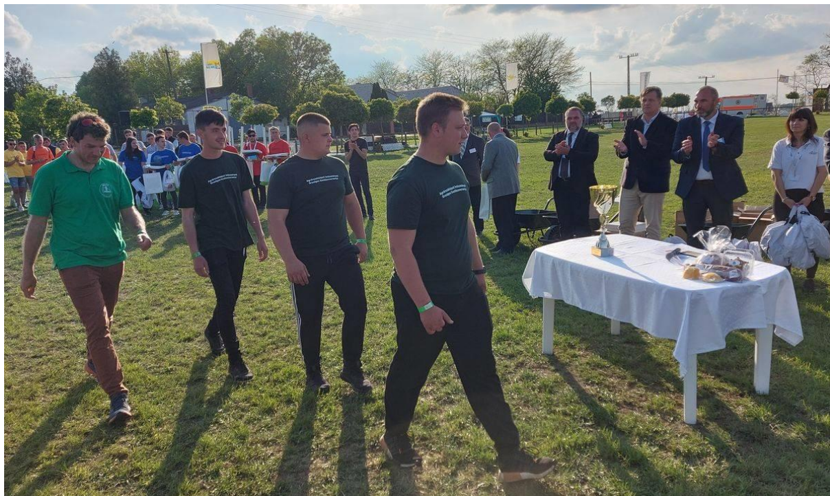
Az első helyezett kiskunfélegyházi csapat

III. helyezett: Kisalföldi ASzC Veres Péter Mezőgazdasági Technikum csapata.